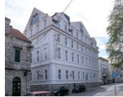
TREBINJE CENTRAL HOTEL 4*