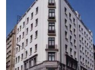
BELGRAD NOBEL PALACE 4*