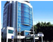
İSKODRA CENTRAL HOTEL 4*