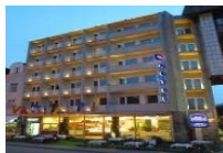
ÜSKÜP HOTEL ACTOR 4*