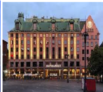
STOKHOLM HOTEL C STOCKHOLM 4* SCANDIC BERGEN 4* SCANDIC