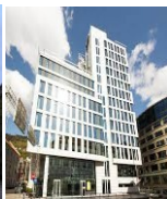
BERGEN 4* SCANDIC