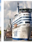
GEMİ DFDS FERRY