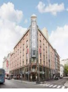
OSLO 4* CLARION HUB 4*