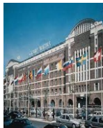
HELSİNKİ GRAND MARİNA 4* SİLJA LİNE VEYA BENZERİ OTELLERDİR .