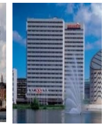
KOPENHAG SCANDIC KODBYEN 4*